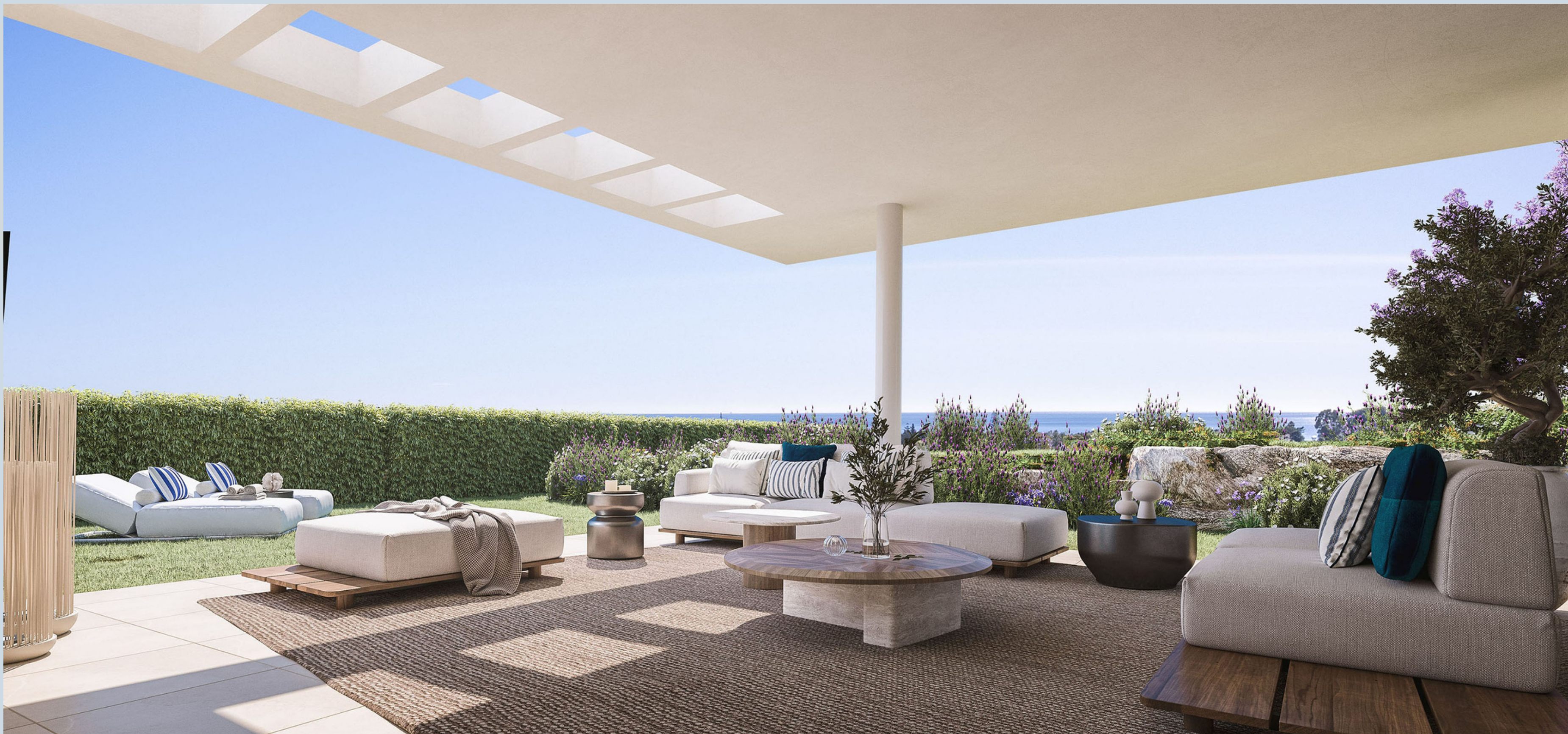
Benedenwoning met een tuin.