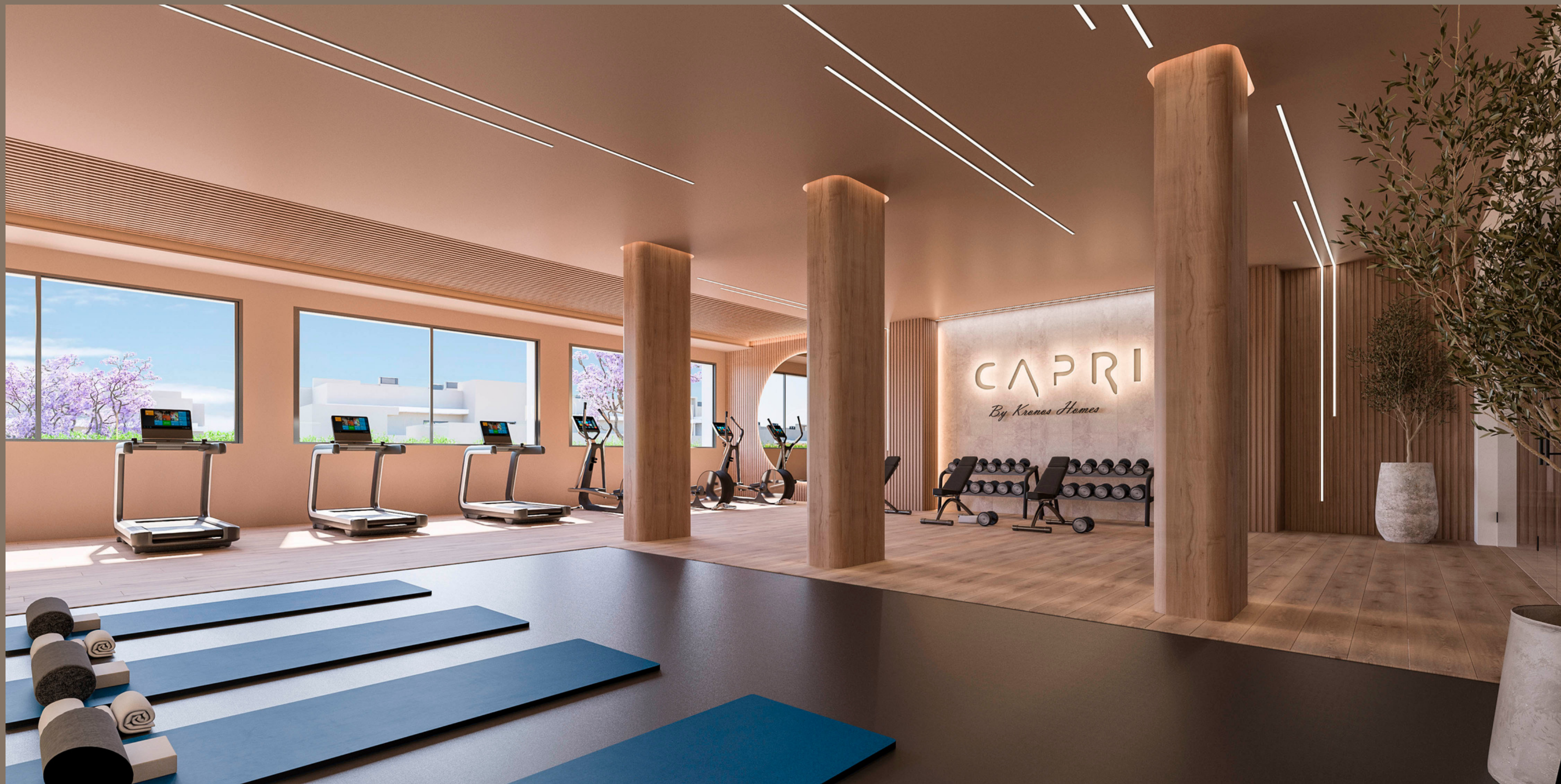
Gemeenschappelijke fitness ruimte in Capri