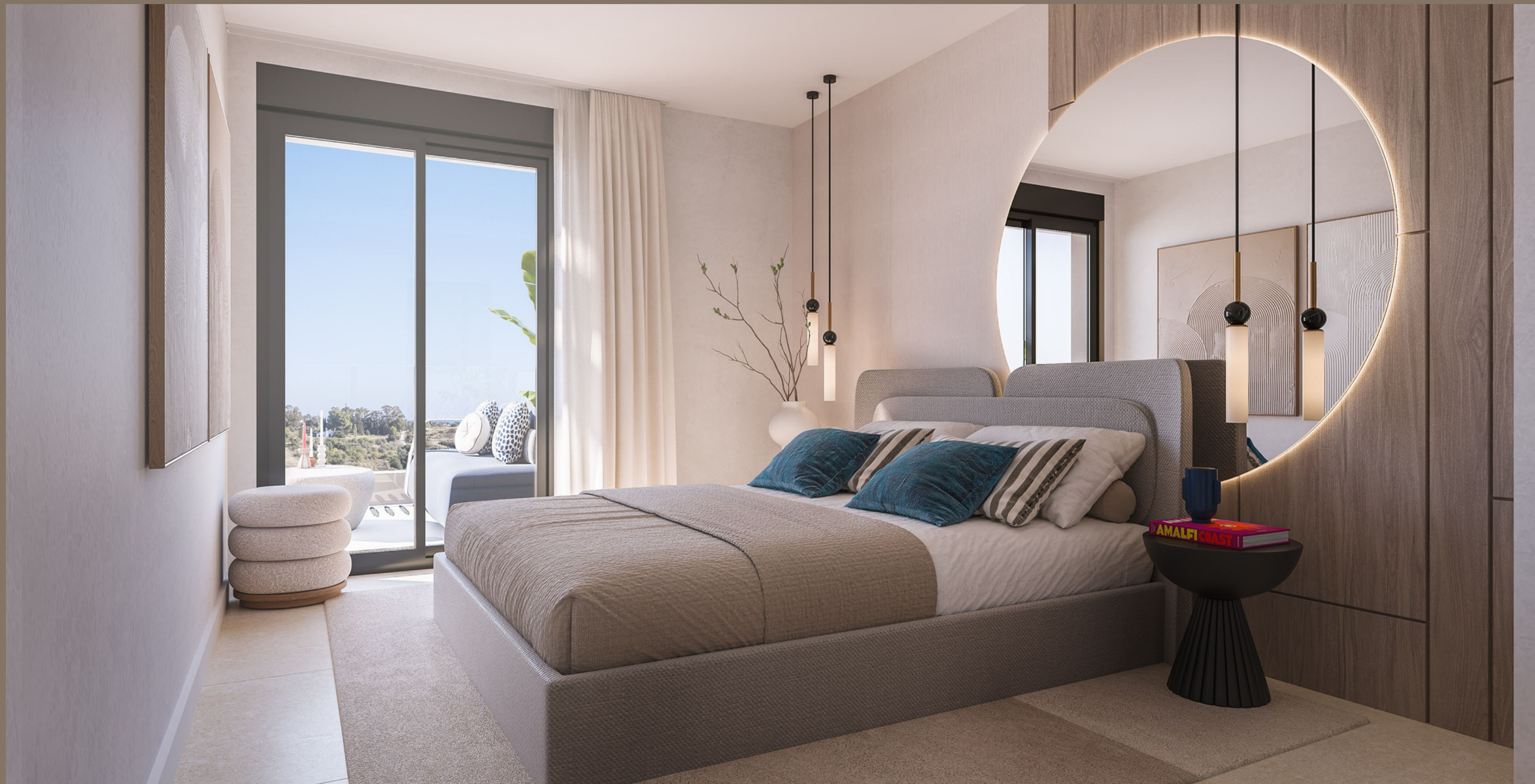
De hoofdslaapkamer is voorzien van ruime inbouwkasten en dubbelglas ramen met een rolluik.