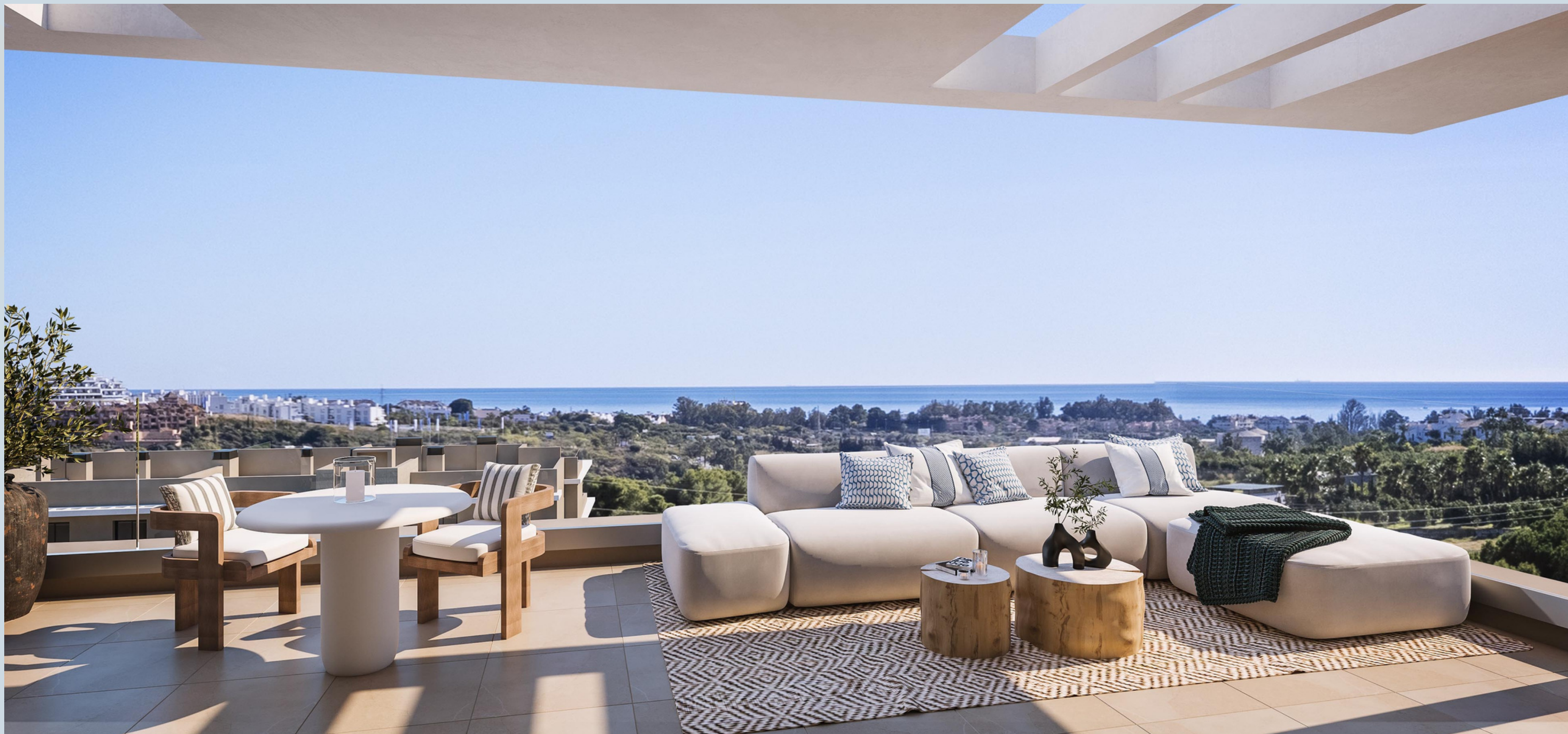
Het uitzicht vanuit het terras van een penthouse woning.